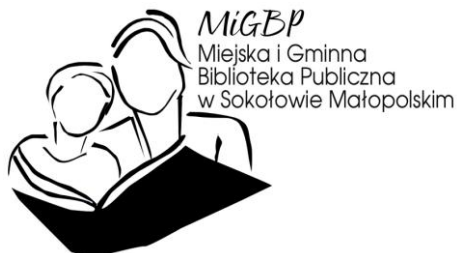
Logo Biblioteki Publicznej